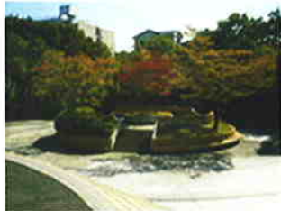
小幡緑地公園の風景1