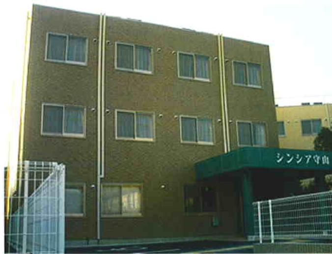
シンシア守山の外観