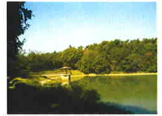
小幡緑地公園の風景2